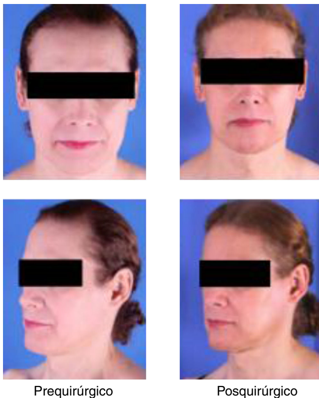
Figura 2 – Cambios pre y posquirúrgicos de la cirugía de feminización; imágenes tomadas por el servicio de cirugía plástica del Hospital de San José.

Los regímenes hormonales en sujetos transexuales se tomaron y fueron adaptados de la Asociación Americana de Endocrinólogos clínicos 1 . Estrógenos, oral: estradiol (2,0-6,0 mg/día); transdérmico: parches de estradiol (0,1-0,4 mg 2 veces a la semana); parenteral: valerato de estradiol o cipionato (5-20 mg cada 2 semanas o 2-10 mg cada semana). Antiandrógenos: espironolactona (100-200 mg/día), acetato de ciproterona (50-100 mg/día) y agonistas de GnRH: (3,75 mg s.c. mensualmente). Fuente: tomado y adaptado de la AAEC 1 .