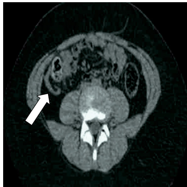
Figura 2. Tomografía computarizada con vista axial del abdomen. La flecha señala el apéndice cecal normal.

La paciente fue manejada en forma conservadora con analgésicos y antiinflamatorios. Ante la ausencia de signos radiográficos de neumatosis, obstrucción o trombos en la vasculatura intraabdominal, fue dada de alta a las 48 horas. Los síntomas desaparecieron con recuperación total a los 10 días. Las imágenes de la tomografía computarizada abdominal de control a las 3 semanas demostraron un área circunscrita de tejido blando aumentado, que reflejaba la resolución lenta del infarto, sin formación de abscesos. La paciente permaneció asintomática en los 12 meses de seguimiento.