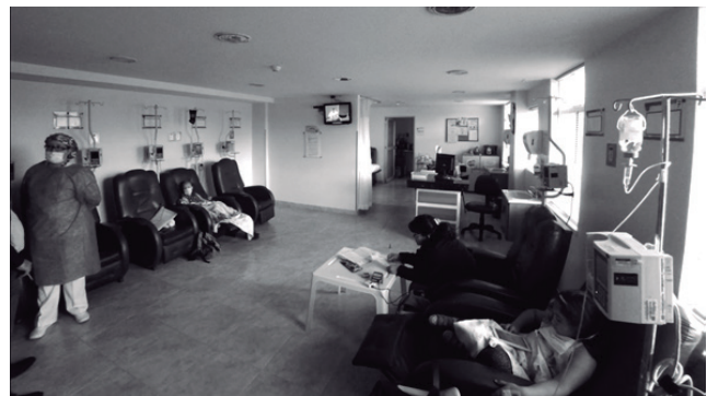
Unidad de Oncología Infantil - Antes.