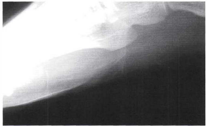
Figura 2. Proyección oblicua de pie que evidencia calcificación nerviosa proyectada sobre la base del quinto metatarsiano.

Dentro de los hallazgos radiográficos se encuentran: edema de tejidos blandos, disminución del espacio articular, resorción ósea, calcificaciones de los nervios, periostitis simétrica, destrucción trabecular con imágenes quísticas y osteomielitis.