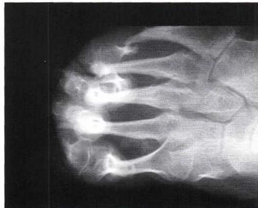
Figura 3. Radiografía antero-posterior del pie en la que se observa resorción ósea de los metatarsianos con patrón en "barra de dulce".