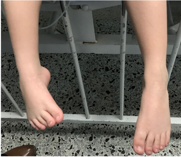
Figura 2 - Pie equino varo posterior a corrección quirúrgica.

marcha. Presenta retraso del lenguaje siendo inteligible, tampoco construye frases, aunque sigue instrucciones simples. Es dependiente para la alimentación, vestido y aseo personal. Cursa además con disfagia frecuente para sólidos y líquidos, y reflujo gastroesofágico.