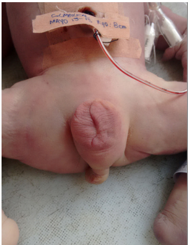
Figura 3 – Transposición penoescrotal completa con escroto intacto y ano imperforado. Caso 2.

El diagnóstico in útero se puede realizar por ultrasonido, escáner 3D/4D o resonancia magnética fetal 2 . En los pacientes donde la presentación clínica es compatible con la vida, el tratamiento es quirúrgico. Las complicaciones quirúrgicas son