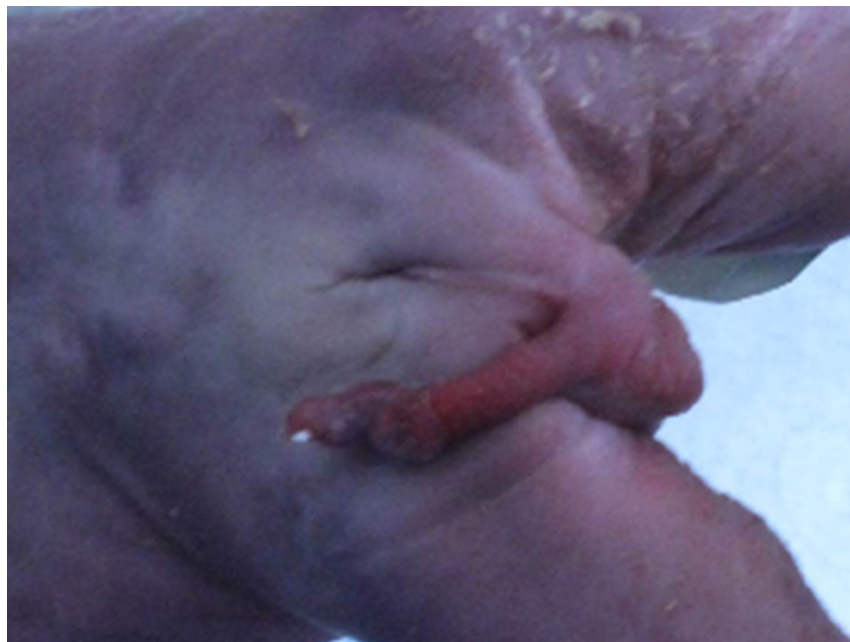
Figura 1 – Transposición penoescrotal completa con escroto intacto, pene flácido y ano imperforado. Caso 1.

La TPE es una anomalía poco común en los recién nacidos 1 . La primera descripción patológica se remonta a 1923 por Appleby 5 . La clasificación depende del posicionamiento anatómico del pene y escroto, siendo mayor o menor 2 . La TPE mayor se clasifica en completa, donde el escroto intacto está ubicado sobre el pene que emerge del perineo 2,6 , o incompleta como en la mayoría de los casos donde el pene se ubica en la