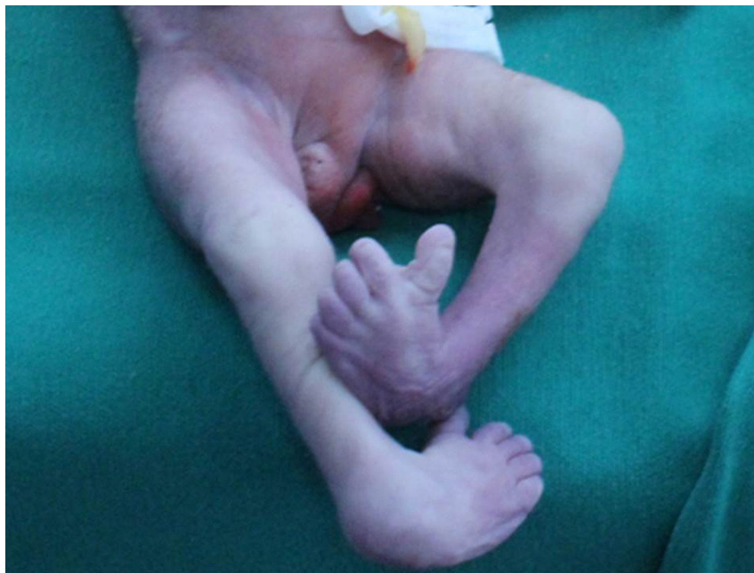
Figura 2 – Pie equino varo. Caso 1.

mitad del escroto. La transposición menor puede ser bilateral (simétrica) o unilateral 1,6 .