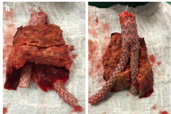
Figura 2. A. Dilatación aneurismática abdominal rota disecada con endofuga tipo IB a nivel de la endoprótesis de aorta abdominal con trombos en su interior. B. Implante de prótesis bifurcada de 20 x 10 cm y saco aneurismático.

Se traslada al paciente a sala de cirugía y dentro de los hallazgos quirúrgicos se describe aneurisma abdominal roto y endofuga tipo IB a nivel de la endoprótesis de aorta abdominal ( figura 2 A y B. ), choque hipovolémico con presencia de hematoma retroperitoneal de aproximadamente 3000 cc. Se coloca clamp en la aorta infrarrenal controlando la hemorragia masiva. Se disecan las arterias ilíacas común, externas e hipogástricas y se anticoagula con heparina 5000 UI. Se abre el aneurisma, se retiran trombos y el implante de prótesis bifurcada de 20 x 10 cm, procediendo a la anastomosis término terminal con prolene 3-0 y término lateral en ilíacas con prolene 4-0, se liberan los clamps y se revisa el sangrado, dejándose empaquetado y con bolsa de peritoneostomía. Se traslada a UCI con doble soporte vasopresor, pero el paciente entra en paro cardiorrespiratorio sin adecuada respuesta a maniobras de reanimación y fallece.