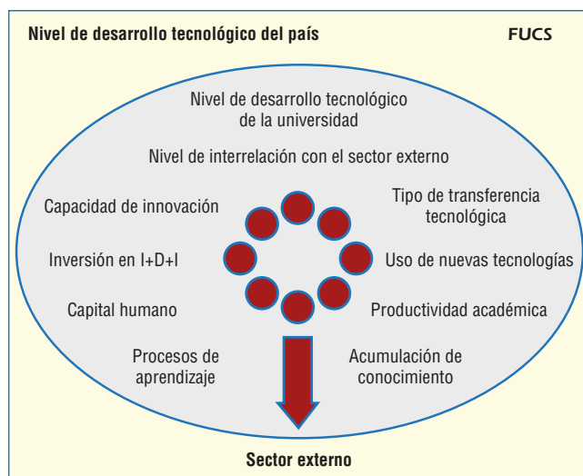
Figura 1. Modelo conceptual de las capacidades tecnológicas de una universidad.

El conocimiento y el análisis de la literatura revisada permiten diseñar un modelo conceptual acorde con las necesidades de la investigación, teniendo en cuenta la orientación hacia las capacidades tecnológicas de las universidades. En este sentido el modelo conceptual es la base para el diseño del instrumento que permita recopilar información de las dimensiones clave inherentes a una organización con características propias, como lo es una “universidad” (figura 1).