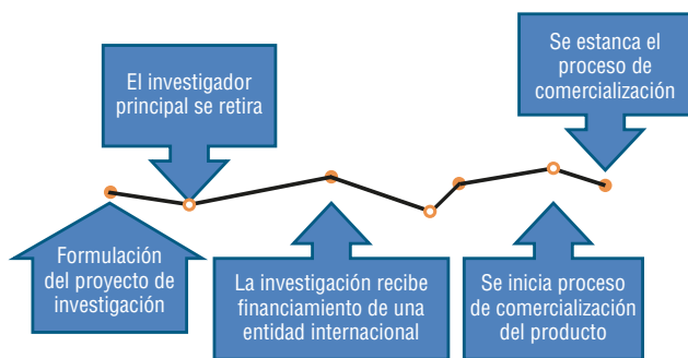
Figura 2. Ejemplo de trayectoria de vida del proyecto o producto de investigación.

I+D+I, uso y apropiación de nuevas tecnologías, gestión del conocimiento, aprendizaje y medición de la innovación (tabla 2). En una tercera fase, se profundiza en las nuevas tecnologías adquiridas por la institución en los últimos diez años y su proceso de aprendizaje, y en aquellos productos/proyectos/servicios con potencial para comercializar o patentar que los actores clave tienen presente.