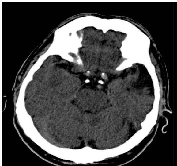
Figura 1 – TAC cerebral simple, que muestra área de encefalomalacia temporal izquierda.

Al no encontrar lesiones agudas en la TAC, se decide realizar, al paciente, una resonancia magnética cerebral simple, que muestra área de encefalomalacia temporal izquierda, sin lesiones agudas. Se complementan los estudios con punción lumbar por el historial de cefalea y leucocitosis, el resultado del líquido cefalorraquídeo (LCR) es: aspecto transparente, presión apertura: 12 cm/H 2 O, leucocitos 6 mm 3 , hematíes 8 mm 3 , proteínas 55, glucosa LCR 67, glucemia 130 mg/dl, índice glucosa 0,51, serología no reactiva, tinciones y Gram negativos. El análisis de este LCR no sugiere infección aguda. Ante la sospecha de descargas epilépticas, se conecta el paciente a la videotelemedicina, encontrándose descargas epiléptiformes lateralizadas izquierdas (por su abreviatura en inglés, PLED) (fig. 2). Se diagnostica estatus discognitivo-afasia (Luders 1997), por lo que se inicia manejo con benzodiazepinas sin lograr mejoría, se hace impregnación con fenitoína 20 mg/kg, sin obtener cambios, se inicia manejo con levetiracetam 2 g por vía oral, y se continúa con 1.000 mg por vía oral cada 8 h, con lo cual el paciente mejora.